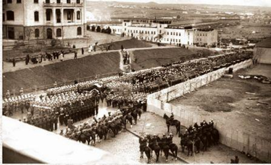
Ankara, 21 Kasım 1938.

bütün vilâyetler ile Kıbrıs'tan getirilen ve harmanlanan vatan toprağı büyük ATA'sını kucakladı. Bugün bu vilâyet toprakları ile sonradan vilâyet olan yerlerden getirilen toprakların numuneleri birer vazo içerisinde, ATATÜRK'ün mezarının etrafını süslemektedir.