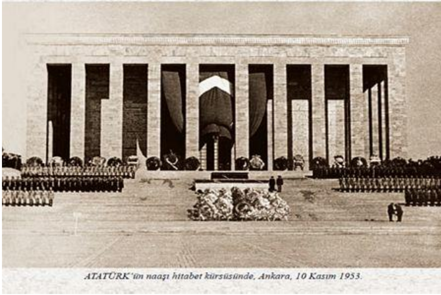
ATATÜRK'ün naaşı hitabet kürsüsünde, Ankara, 10 Kasım 1953.