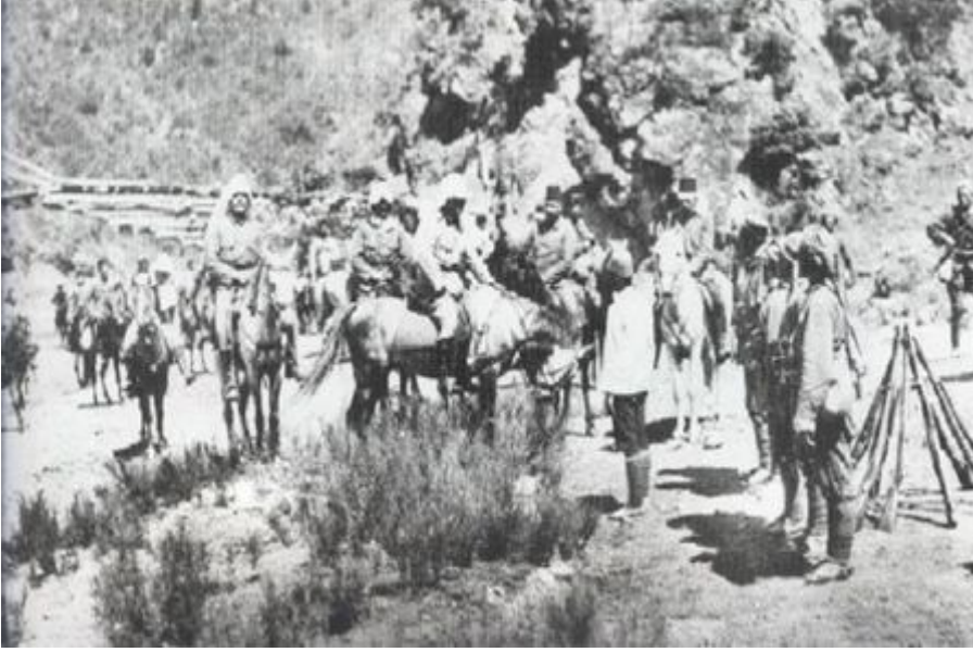
Osmanlı Askerleri –1913

Balkan devletleri arasındaki ilk ittifak 13 Mart 1912'de yapılan "Sırp-Bulgar İttifakı" olmuştur. Bu ittifaka göre taraflar birbirlerinin bağımsızlık ve toprak bütünlüklerini koruyacaklar, birine bir saldırı olursa diğer taraf müttefikine yardım edecektir. Osmanlı Devleti iç karışıklıklara maruz kalır ve bunun sonucunda Balkan statükosu bozulursa, ortak hareket edilerek Rusya'nın yardımı ile savaşa başlanacaktır. Savaş sonunda ele geçirilen topraklar paylaşılacaktır.