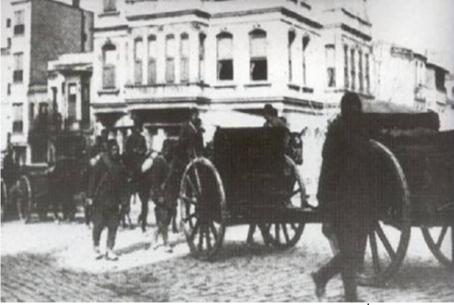
Osmanlı Topçuları Çatalca Yönünde İlerlerken-1913

Osmanlı Devleti savaşa oldukça zor şartlar içinde girmiştir. Ordunun geri hizmet teşkilatı kötü durumdaydı. Savaşın ilk gününden itibaren her alanda ikmal güçlükleri kendini göstermiş, bu da orduyu zafiyete uğratmıştır.