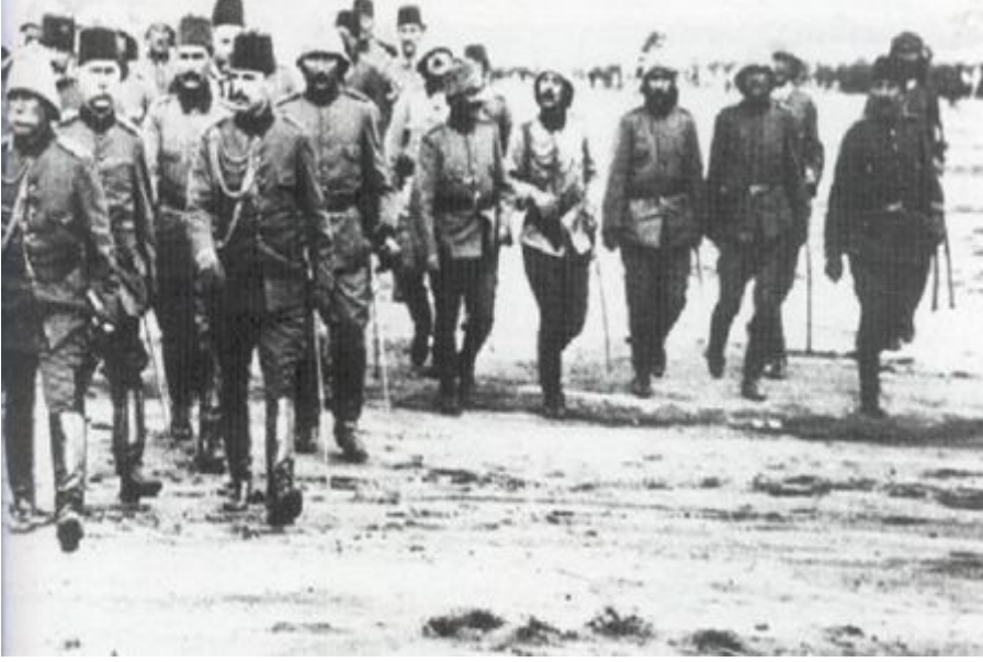
Edirne'yi Alan Osmanlı Subayları- 22 Temmuz 1913

Bu barış ile Osmanlı Devleti, geleceğinin tayinini ve Arnavutluk'un sınırlarının çizilmesi işini büyük devletlere bırakmıştır. Yani Osmanlı Devleti, Arnavutluk'un bağımsızlığını tanıyor ve bu toprakları da kaybediyordu. Bundan başka Girit'i de Yunanistan'a terk ediyordu. Nihayet Osmanlı Devleti, Midye–Enez çizgisinin batısında kalan bütün Avrupa topraklarını Balkanlılara bırakıyordu ki bununla Edirne Bulgaristan'a geçiyor ve Bulgaristan Kavala ile Dedeağaç arasındaki toprakları alarak Ege Denizi'ne çıkıyordu. Osmanlı Devleti'nin Balkanlar'da sadece Bulgaristan'la sınırı oluyordu.