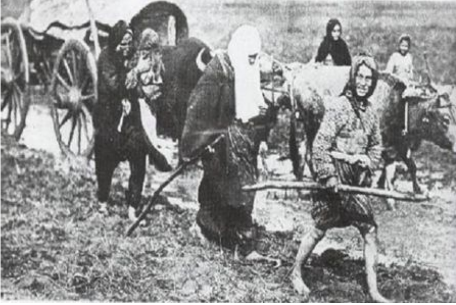
Bulgarlardan Kaçan Türk Köylüleri-1912

Sırbistan ile yapılan antlaşma 13 Mart 1914 günü İstanbul'da imzalanmıştır. Bu anlaşmada da Sırbistan'da kalan Türklerin statüsü belirlenmiştir. Sırbistan ile ortak sınırimız kalmadığı için sınır meselesi söz konusu olmamıştır.