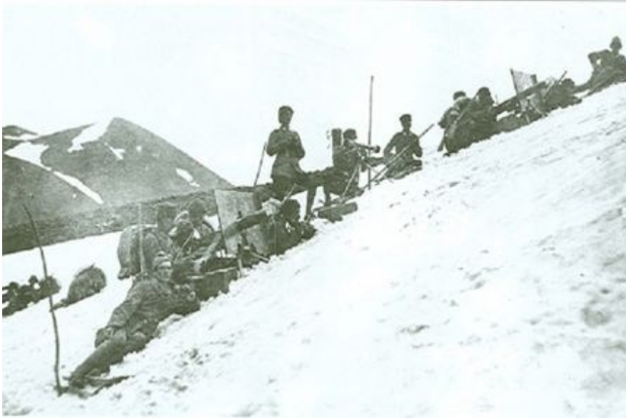
Doğu Cephesi'ndeki Makineli Tüfek Birliği-1915

Doğu Cephesi'ndeki savaşlar, Rusların 1 Kasım 1914'te saldırıya geçmeleriyle başlamıştır. Rusların bu saldırıları başarıyla durdurulduktan sonra, kesin sonuç almak amacıyla harekete geçilmiştir.