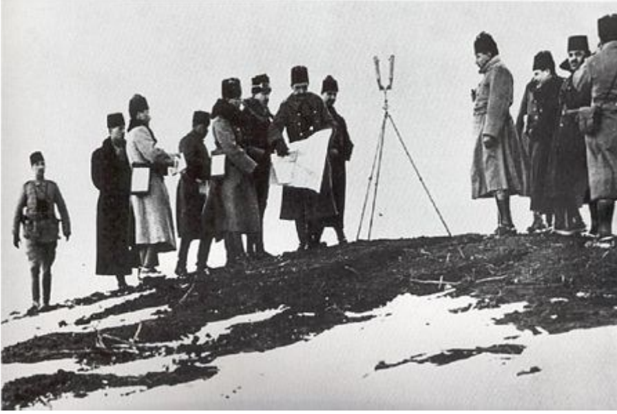
Galiçya Cephesi'ndeki Türk Subayları-1916

31 Ağustos'ta Alman Güney Ordusuna Rus birliklerinin taarruzu başlamıştır. Türk birlikleri bu mevzide başarılı savunma yapmalarına rağmen Güney Ordusu'ndan aldığı emirle, 6 Eylül günü geri çekilmiş, 20'nci Tümen büyük zayıat vermiştir.