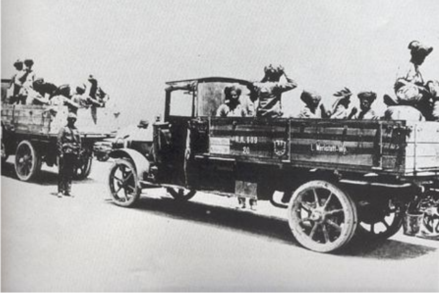
Kut'ül-Ammare'de esir alınan İngiliz birlikleri içindeki Hintli askerler cephe gerisine gönderiliyorken-1916