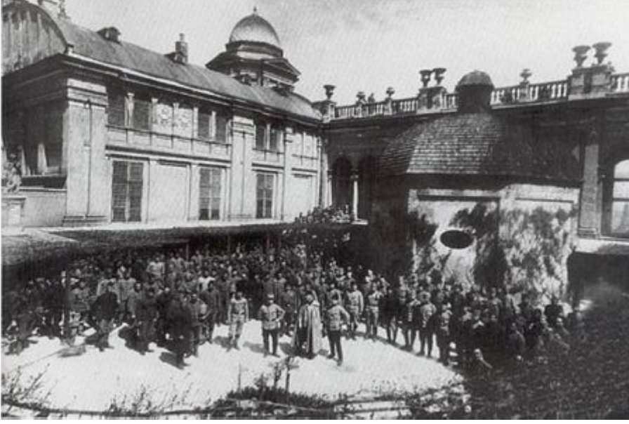
Başkomutan Vekili Enver Paşa Budapeşte'de-1916

Birinci Dünya Savaşı sırasında, Avusturya-Macaristan'ın bir eyaleti olan Galiçya'ya gönderilen 15'inci Türk Kolordusu, ilk defa yurt dışında, müttefik devletlerin komutanları emrinde savaş görevi yapan birlik olması bakımından ayrı bir önem taşımaktadır.