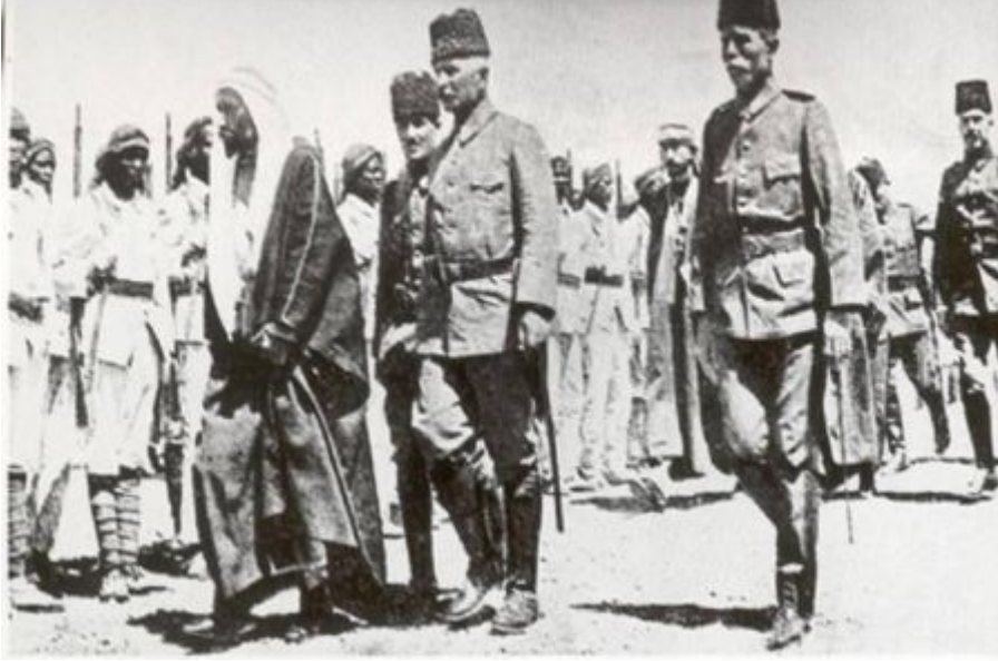
Hicaz Kuvve-i Seferiye Komutanı Fahrettin (Türkan) Paşa ve Emir Ali Haydar Türk-Arap Birliğini Denetliyor, Medine-1917

Birinci Dünya Savaşı'nda Türk halkının vicdanında en derin etkileri yaratan cephelerden birisi de Hicaz-Asir-Yemen Cephesi'dir. İngilizler, 1880'lerden itibaren, halifeliğin Arapların hakkı olduğunu ve onların Osmanlı'dan ayrı kendi himayesinde kurulacak devletlerini destekleyeceklerini telkin etmişlerdir. Bu propagandaların yanı sıra bilhassa XX. yüzyıl başlarında Trablusgarp ve Balkan Savaşları'na maruz kalması, Arap coğrafyasında hareketlenmelere neden olmuştur. Bu yüzden bu cephedeki mücadeleler, İngilizlerin kışkırttığı asi kabile şeflerine ve Mekke Şerifi'ne karşı yapılan muharebelerden oluşmaktadır.