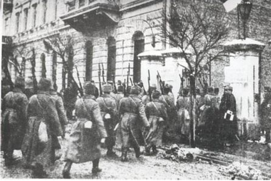
Rus Birliklerinin Doğudaki İlerleyişleri -1916

Tamamen karlarla kaplı, çok yüksek dağlık ve yolsuz bir arazide o günün koşulları altında yapılan bu harekât çok zor idi. Özellikle 10'uncu Kolordu birlikleri, Allahuekber Dağları'nı aşarken çetin zorluklar ve kış şartları sebebiyle gerek personel gerekse mevcut silahlar yönünden büyük zayıflık vermiştir. Nitekim Türk kuvvetlerinin büyük bir bölümü soğuktan donarak şehit olmuştur. Sarıkamış'a girebilen kuvvetler de Ruslar tarafından geri atılmıştır. Bu başarısızlık karşısında Enver Paşa, 10 Ocak 1915'te 3'üncü Ordu Komutanlığını, Hafız Hakkı Paşa'ya devrederek İstanbul'a dönmüştür.